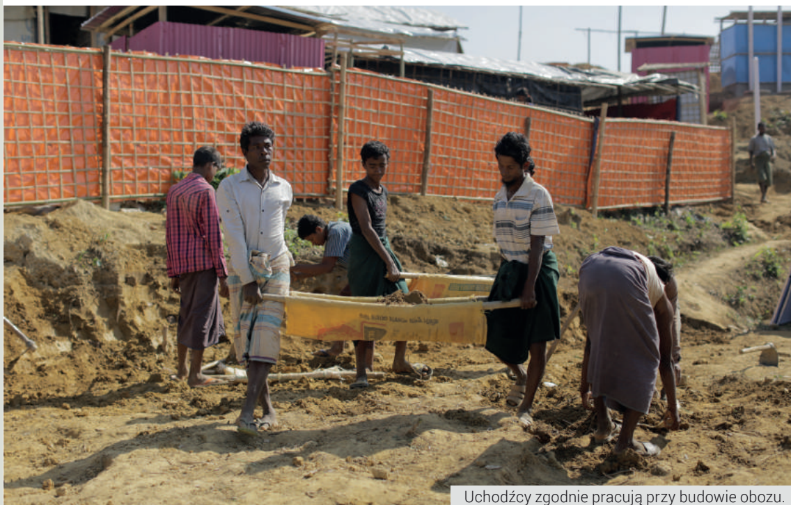
Uchodźcy zgodnie pracują przy budowie obozu.

Uczeń pomaga szerzyć postawy tolerancji. W swoich poczynaniach nie sugeruje się wiarą czy poglądami innych, nie ocenia nikogo ze względu na przekonania. Bycie tolerancyjnym pomaga uważniej patrzeć na świat i ludzi, buduje nić porozumienia i pozwala na życie w zgodzie z innymi. Wyznawane przez ucznia wartości po takiej lekcji mogą zmienić podejście innych w jego otoczeniu.