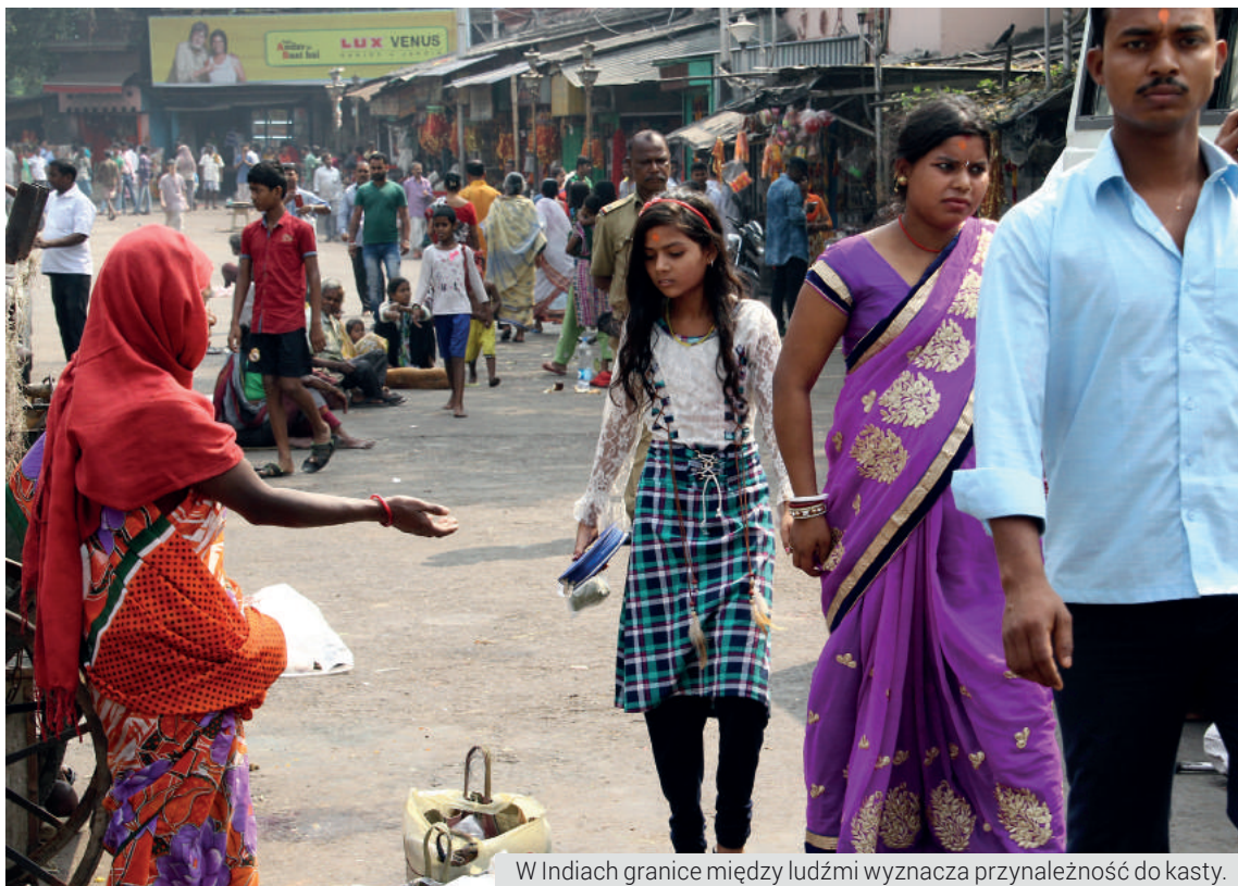
W Indiach granice między ludźmi wyznacza przynależność do kasty.