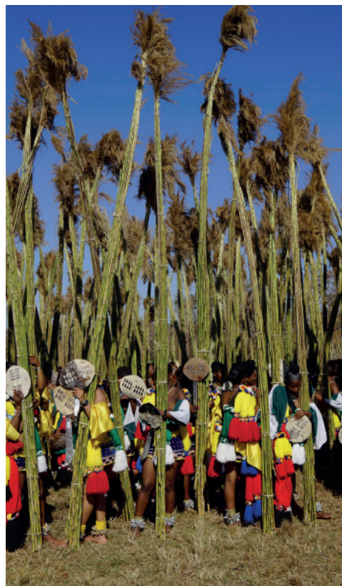
Młode dziewczęta biorą udział w tańcu trzcin.

Podkreśl, że wyrażenie „darzyć kogoś szacunkiem” oznacza obdarowywać kogoś czymś ważnym. Okazywanie szacunku drugiemu człowiekowi to dawanie mu szansy na rozwój, na stawanie się lepszym człowiekiem. Jest fundamentem jego godności. Prawo do szacunku jest