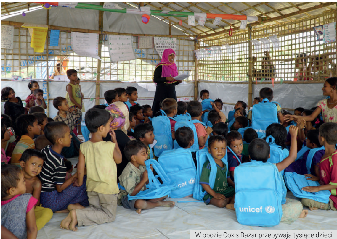
W obozie Cox's Bazar przebywają tysiące dzieci.