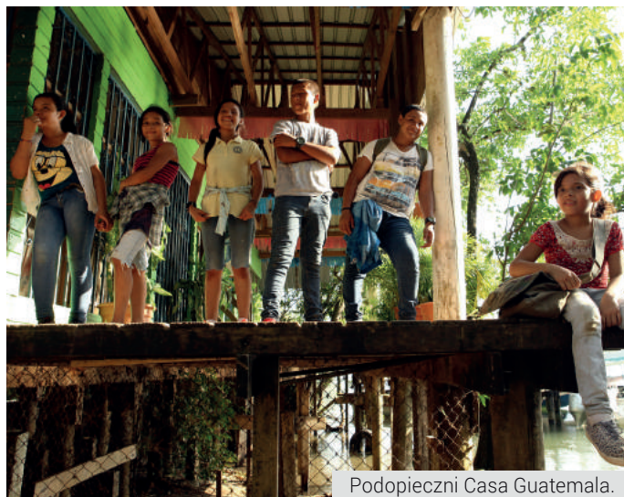
Podopieczni Casa Guatemala.