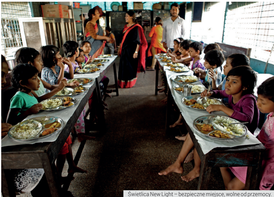
Świetlica New Light – bezpieczne miejsce, wolne od przemocy.