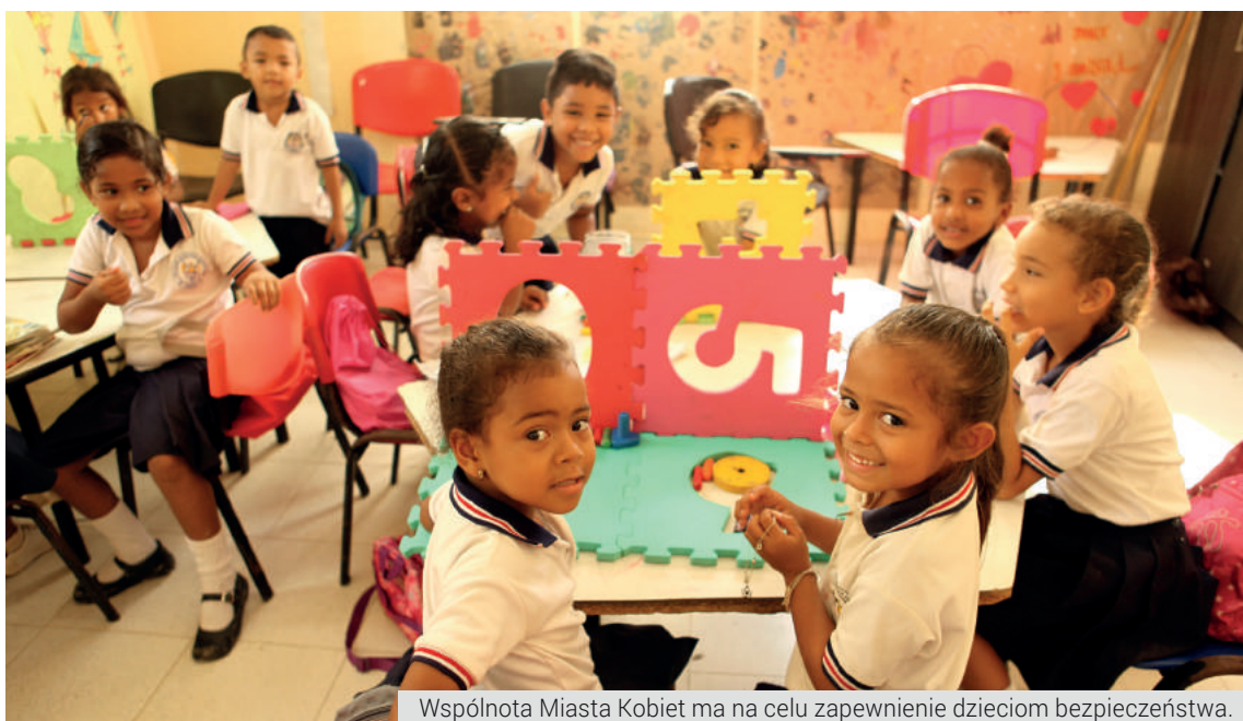
Wspólnota Miasta Kobiet ma na celu zapewnienie dzieciom bezpieczeństwa.