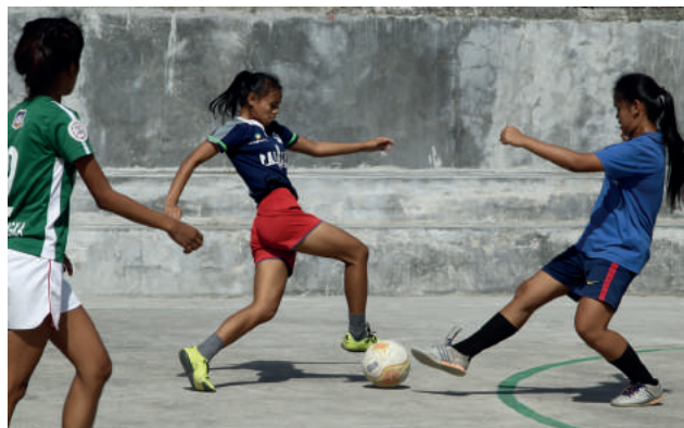
Drużyna Team Philippines zajęła IV miejsce w Street Child World Cup 2018 w Moskwie, czyli w mundialu dla dzieci ulicy.

Zapytaj uczniów, czy w sprawach problemowych, ważnych, czekają, aż ktoś pomoże im je rozwiązać, czy sami poszukują pomocy? Są takie miejsca na świecie, w których bez organizacji charytatywnych, pozarządowych, żyłoby się bardzo źle. Brak dostępu do edukacji, opieki medycznej i pożywienia jest w niektórych krajach normą, a władze lokalne nie mogą lub nie chcą tego zmienić. Właśnie dlatego tak ważne jest przekazywanie informacji o tych, którzy nie mogą walczyć o swoje prawa samodzielnie. Szerzenie wiedzy o ich sytuacji jest już formą pomocy. Taka działalność umożliwia dotarcie do osób mających środki i możliwości niesienia realnej pomocy. Zapytaj uczniów, czy podczas zadania czuli, że okazują zainteresowanie sprawom ważnym, lub czy sądzili, że takie działania mogą być pomocne. Poproś o uzasadnienie opinii. Podziękuj uczniom za kreatywność, uwagę i działalność twórczą. Powiedz, że ich zaangażowanie jest bezcenne w procesie uczenia się.