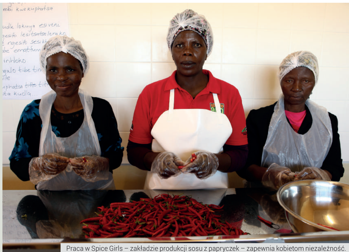
Praca w Spice Girls – zakładzie produkcji sosu z papryczek – zapewnia kobietom niezależność.

podstawowym prawem każdego człowieka zagwarantowanym w Konstytucji Rzeczypospolitej Polskiej. W artykule 30. tego dokumentu zapisano: „przyrodzona i niezbywalna godność człowieka stanowi źródło wolności i praw człowieka i obywatela. Jest ona nienaruszalna, a jej poszanowanie i ochrona jest podstawowym obowiązkiem władz publicznych”. Natomiast artykuł 32. głosi, że „nikt nie może być dyskryminowany w życiu publicznym, społecznym lub gospodarczym z jakiegokolwiek przyczyny”.